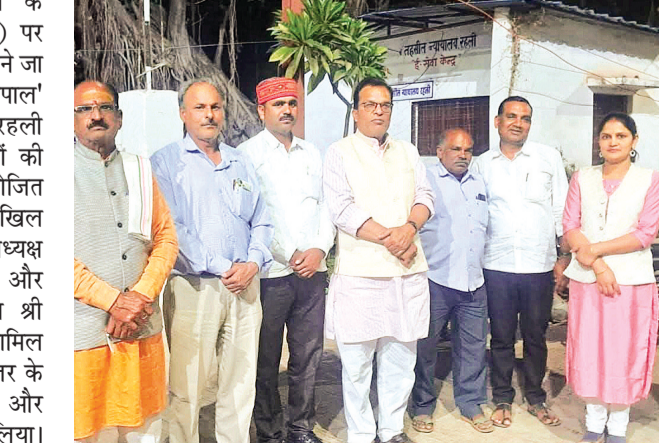
अमेरिका ट्रेड डील के विरोध में यह महाचौपाल बुलाई गई है। कार्यकर्ताओं से अपील की गई कि वे अधिक से अधिक संख्या में भोपाल पहुंचकर इस कार्यक्रम को सफल बनाएं।