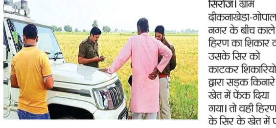
होने की सूचना गामियों द्वारा दी। वन विभाग की टीम जांच में जुटी।