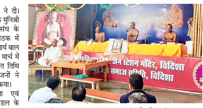
महाराज ने कहा कि भगवान श्री आदिनाथ बरों वाले बाबा विदिशा के

संत शिरोमणि आचार्य गुरुदेव विद्यासागरजी महामुनिराज एवं नवोदित आचार्य समयसागर महाराज के आशीर्वाद से शीतलधाम में विराजमान बरों वाले बड़े बाबा को उच्च स्थान पर विराजमान कराने तथा नवीन जिनविम्बों के पंचकल्याणक का आयोजन आगामी मार्च माह में होने की संभावना है। यह जानकारी सकल दि. जैन समाज के प्रवक्ता