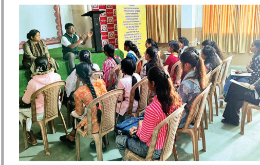
हरिभूमि न्यूज ► सिरोंज