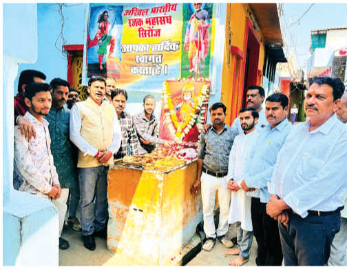
हरिभूमि न्यूज ► सिरोंज

अखिल भारतीय रजक महासंघ द्वारा शिक्षा, स्वच्छता एवं समानता की राह दिखाने वाले महान संत शिरोमणि